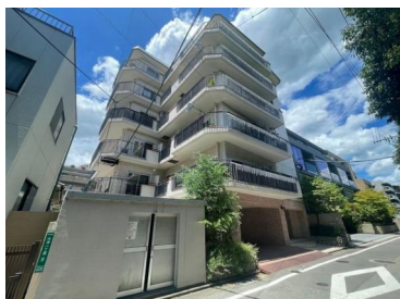
[外観・現況][外観写真]外観