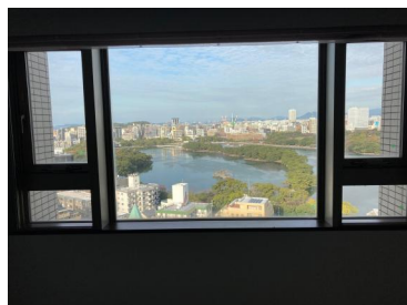
[その他][その他]室内からの眺望