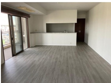
[専用部・室内写真][リビングダイニング]