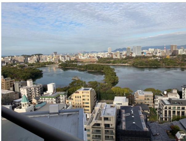
[その他][その他]バルコニーからの眺望