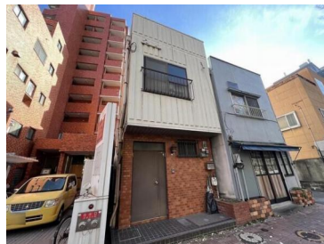
[外観・現況][現況写真]