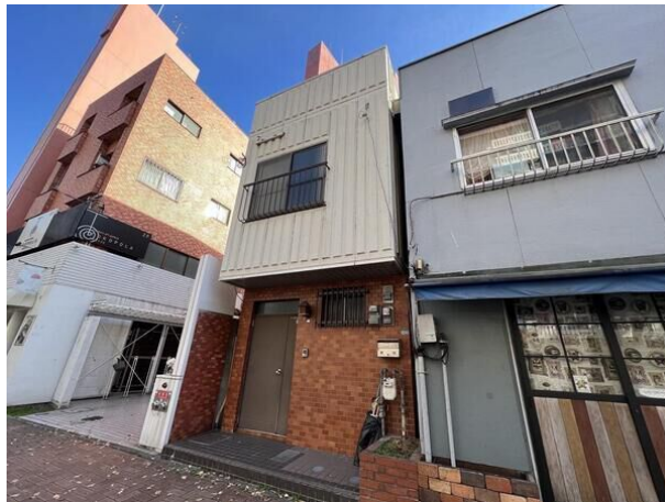
[外観・現況][現況写真]

けやき通り沿いの土地でございます。 建築条件付きの土地ではございません。お好きなハウスメーカーや建設業者で建築可能です。 店舗用地、事務所用地、住宅用地として、幅広くご検討ください。