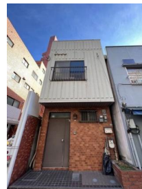
[外観・現況][現況写真]