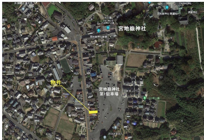
[外観・現況][現況写真]