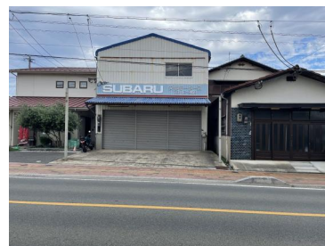
[外観・現況][現況写真]

※物件情報は下記情報公開日時点のものです。現状が異なる場合は、現況優先となりますので、最新情報をご確認ください。