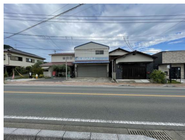
[外観・現況][現況写真]