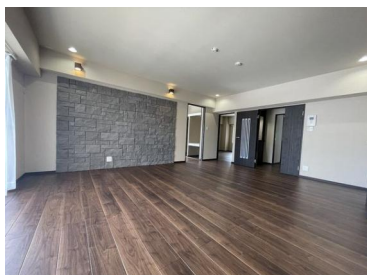
[専用部・室内写真][リビングダイニング]LDK (約24.0帖)