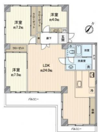
[間取り図・図面][間取り図]