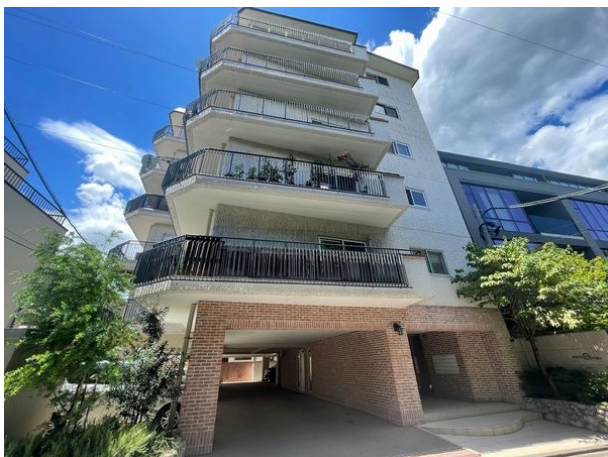
[外観・現況][外観写真]