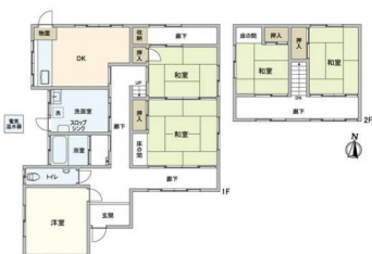
[間取り図・図面][間取り図]