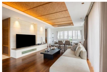
[専用部・室内写真][リビングダイニング]