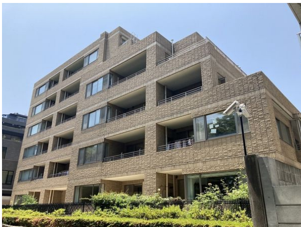
[外観・現況][外観写真]

◆大濠一丁目アドレス◆最上階メゾネットタイプ◆2011年内装フルリノベーション履歴あり◆室内程度良好