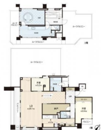
[間取り図・図面][間取り図]