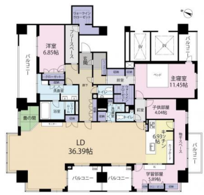
[間取り図・図面][間取り図]