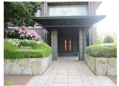
[共用部・設備施設][未設定]マンション入口