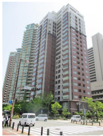
[外観・現況][外観写真]

積水ハウスグランドメゾンシリーズ、23階建の19階部分角部屋3面採光、専有面積約201.50㎡の3SLDK、令和2年4月玄関ホール・LDK床 石調タイル張替(床暖房有) キッチン取替え済、ビルトインエアコン取替え済、令和4年5月室内クロス張替・ハウスクリーニング済、リビングから福岡タワー・マリゾン 等望む、室見川・脊振山系・百道浜小学校等望む、広々LDK約43帖のカウンターキッチン・カップボード・畳の間有、トイレ2箇所有、ウォークインクローゼット2箇所有 ・フリースペース収納等多数有、広々玄関ホール横シューズボックス有、広々洗面所ポール2個有・浴室乾燥等設備・シャワールーム有。