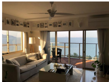
[専用部・室内写真][居間・リビング]