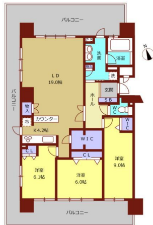
[間取り図・図面][未設定]

■天神から車で20分のリゾートライフをあなたに。■潮騒で目覚める癒しの毎日～波の音を聞きながら、入浴も、睡眠も～