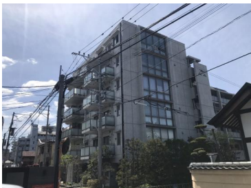
[外観・現況][外観写真]