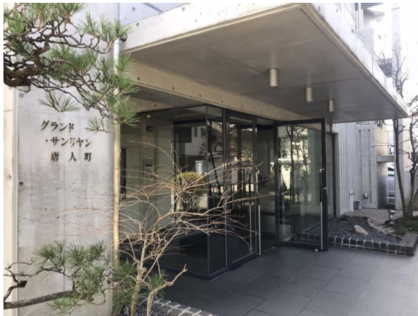
[外観・現況][外観写真]