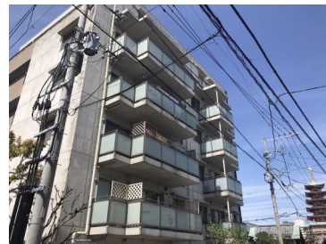
[外観・現況][外観写真]