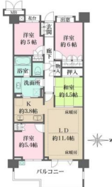
[間取り図・図面][間取り図]専有面積約81.11㎡、最上階5階部分東向き4LDK