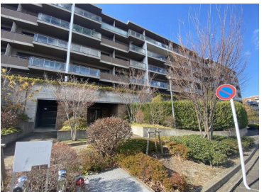
[外観・現況][外観写真]緑深き閑静な住宅街種やかな日常を享受できる高宮エリア。