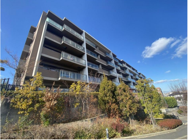
[外観・現況][外観写真]2012年8月築、RC造地上5階建地下1階建、総戸数115戸

緑深き閑静な住宅街種やかな日常を享受できる高宮エリア。西鉄天神大牟田線「高宮」駅より徒歩約12分。2012年8月築、RC造地上5階建地下1階建、総戸数115戸の三菱地所グループマンションです。専有面積約81.11㎡、最上階5階部分、東向き4LDKのお部屋です。眺望・通風と住環境は良好、利便施設も充実しており、また共用部分ではエントランスホール・コリドー・グリーンガーデンなどと共用部分全体に自然な暖かさが漂うライフスタイルを満喫できる仕様となっております。将来に叶えたい暮らしをきちんと想定した上で心から「安心」そして「納得」できる「住まい」を見つけてください。物件詳細などお気軽にお問合せください。●おすすめポイント●最上階地上5階部分、見晴らしがよい希望が叶うお部屋・約15.2帖のLDK、LD部分には床暖房あり・ペット飼育可(規約による制限あり)・24時間安心して暮らせるためにオートロックセキュリティ・TVモニター付インターホン・リングシャッター・周辺環境は利便施設が充実【備考】●ペット飼育:可(1住戸につき犬・猫併せて2匹まで。また体長等制限あり)●駐車場空き状況:空有(月額5000円~18000円)現在9台有 2022年1月6日現在●分譲会社:三菱商事株式会社